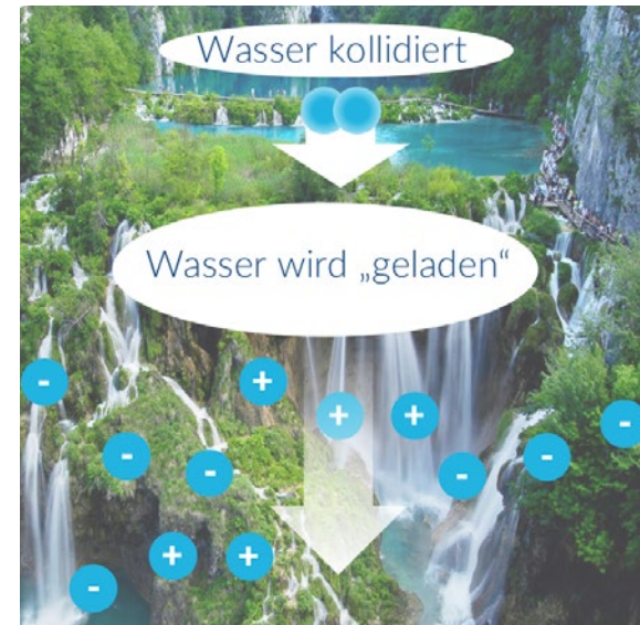
Umgebungsluft wird „geladen“.