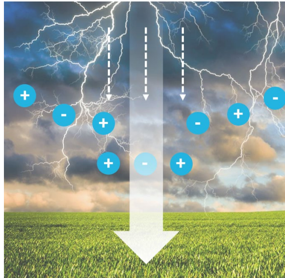
Eine große Menge an Ionen wird durch ein elektrisches Entladungsphänomen erzeugt.

Vor einem Gewitter gibt es eine sehr hohe Konzentration von Schadstoffen in der Luft - wie Staub, Bakterien, Pollen, Chemikalien und Rauch. Der Sturm löst elektrische Entladungen aus und dadurch werden hohe Konzentrationen von Ionen emittiert. Ionen spielen eine wichtige Rolle, um Luftschadstoffe zu senken - und geben uns somit ein Gefühl von frischer und sauberer Luft.